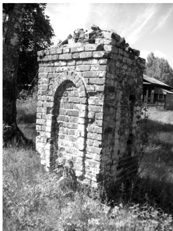
Башенка церковной ограды, конец XIX – начало XX в.

выявлено, но, после его обнаружения мы будем располагать точной информацией на эту тему.