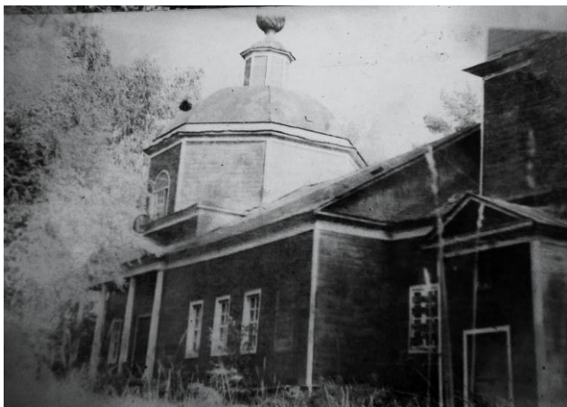
Храм погоста Шатур в середине XX столетия

юный учащийся Егорьевской мужской прогимназии, Игорь Эммануилович Грабарь. Эти росписи сохранялись и во время закрытия храма. Об их дальнейшей судьбе мы скажем ниже.