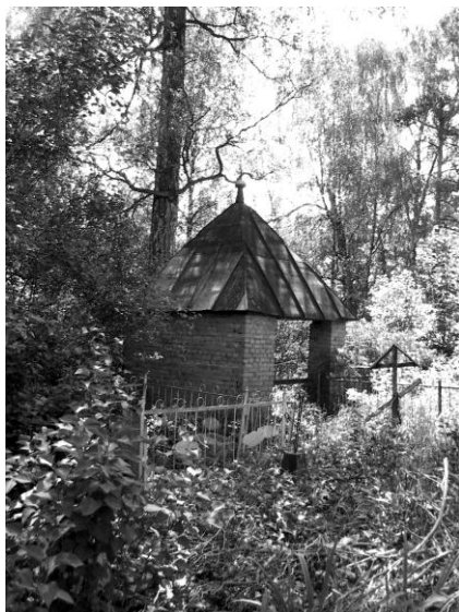
«Часовенка» на Шатурском кладбище. XX столетие.

1713 г. декабря 22 запечатан наказ духовнаго приказу по- дъячому Петру Коврову ехать ему в Волод. уезд в в Николае- евской погост, что в Шатуре по Николаевскаго попа Григо- рья Гаврилова да по дьякона Корнила Зотова да дьячка Бориса Зотова в духовном деле за поруками привести к от- вету к Москве, пошлин 8 алтын 2 деньгу 2 .