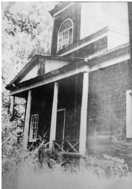
Храм погоста Шатур. Фото середины XX столетия

в месяц). В школе учение продолжалось восемь-девять месяцев в году. Как таковым «селом» Шатур не был, а представлял собой обычный для центра России погост, где проживало пять семей священно- и церковнослужителей, также еще три семьи духовного звания, одна семья бывшего дворового деревни