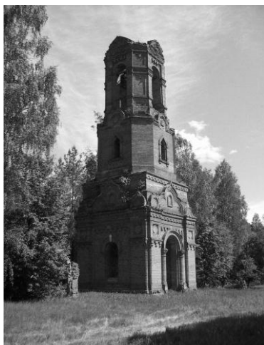
Каменная колокольня храмов погоста Шатур, 1910 г. Фото 2000-х годов.

ят из приходских отдельных населенных местностей. Школа подразделяется на три группы: старшую, среднюю и младшую. Обучение ведется в ней удовлетворительно. Списки учеников и журналы для записи уроков ведутся исправно. Во время посещения школы Его Высокопреосвященство испытывал учеников в знании закона Божия, русского языка и арифметики; ученики были вызываемы по списку младшей, средней и старшей групп» 115 .