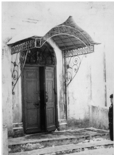
Фото 1960-х гг. из архива У.Г. Андрияновой

ссылаются на наличие того или иного праздника. Однако снижение посещаемости молитвенного здания за последний год заставляет искать причину плохого отношения к работе в колхозе в другом. Может быть материальная выгода заставляет некоторых предпочитать колхозной работе другие занятия. Здесь, в прошлом, благодаря наличию большого количества кустарей-трикотажников, все поезда бывало встречались продавцами чулок, перчаток и т.п.» 49 . Видимо, власти были озабочены заслуженным отношением селян к колхозу и пытались найти ему любое обоснование. Здесь, по их мнению, были виноваты и церковь, и кустари.