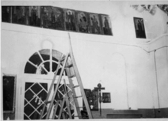
Фото 1960-х гг. из архива У.Г. Андрияновой

Первое время старообрядцы-гуслики пытались наладить духовную жизнь, подобную той, что была у них до безбожного разорения. В том же 1946 году устьяновские прихожане нашли возможность принять в своем храме для проведения молебна чтимую Казанскую Губинскую икону Пресвятыя Богородицы 45 . Прежде, до прихода к власти безбожников, этот чудотворный образ регулярно носили по гуслицким селениям. Но после 1946 года власти пресекали попытки возродить эту старинную традицию.