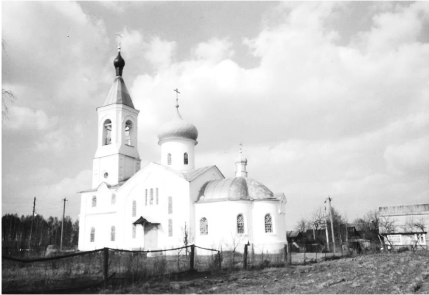
Никольский храм в Устьянове. Современное фото.

В начале 2010-х гг. начался период столетних годовщин в истории старообрядческого храма Святителя Николы Чудотворца в селении Устьяново, которое расположено в южной части Гуслиц, рядом с границей Орехово-Зевского и Егорьевского районов. В 1911 году был освящен прежний деревянный храм, который оказался временным и просуществовал всего несколько лет. В 1914 году был заложен и начат строительством нынешний каменный храм. В 1917 году он был освящен. Последний факт весьма примечателен: во всей России в том году все походили с ума и творили революции, а в старообрядческом селении Устьяново жили спокойно и освящали новый храм.