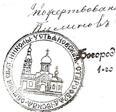
Печать Устьяновской общины