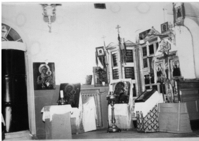
Фото 1960-х гг. из архива У.Г. Андряновой

Глеба во священники к храму села Дворцы Калужского уезда. В 1929 году он вернулся на приход родного селения Острая Лука. В 1933 году отца Глеба осудили на пять лет, но уже в августе 1936 года освободили. В 1941 году, во время наступления немецко-фашистских войск, он эвакуировался в Горьковскую (ныне – Нижегородскую) область, где работал плотником на строительстве Перевозской ГЭС.